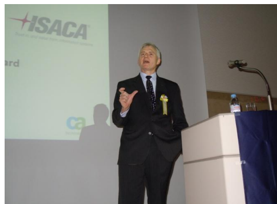
2013年カンファレンス講演風景 (2013.11月)